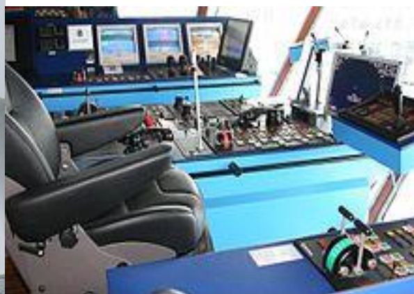
Poste de pilotage