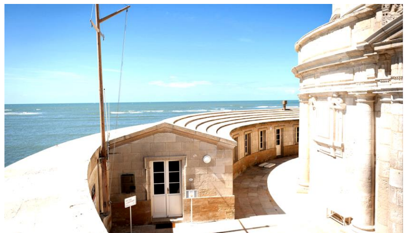
Cour intérieure avec logements des gardiens

Ils se relaient au phare deux par deux, au rythme d'une semaine ou d'une quinzaine. La « relève » chassé-croisé des gardiens se déroule le vendredi aux heures dictées par la marée, au départ du Verdon-sur-mer, à bord du navire de l'Armement des Phares et Balises. Leur mission : assurer l'entretien courant, une présence jour et nuit, accueillir et renseigner les visiteurs pendant la saison touristique, participer au suivi environnemental du plateau rocheux.