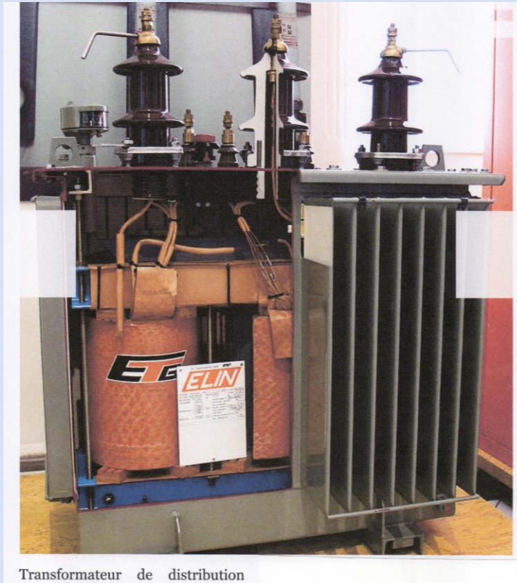
Transformateur de distribution