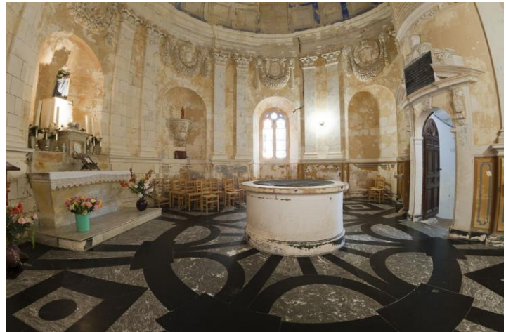
La chapelle Royale