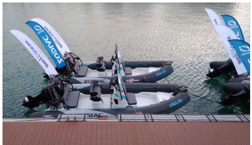
Zodiacs des équipes d'assistances à quai

Le départ sera donc le dimanche 7 janvier vers 13h30.