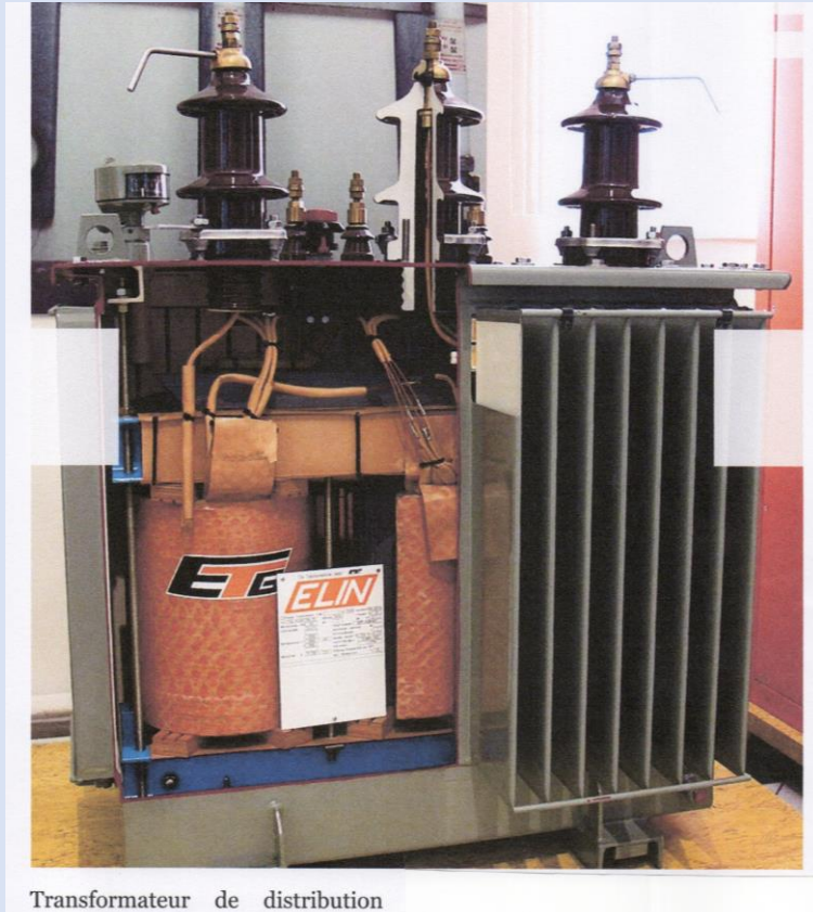
Transformateur de distribution